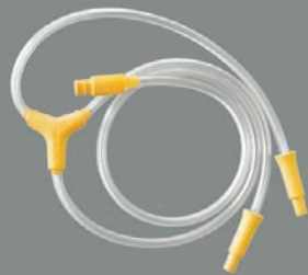
1 x slange