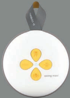
1 x Swing Maxi™ pumpeenhet