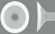
2 x PersonalFit Flex™ brystrakt 24 mm