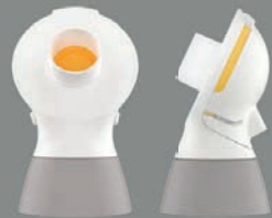
2 x PersonalFit Flex™ kobling