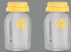
2 x 150 ml flaske med lokk